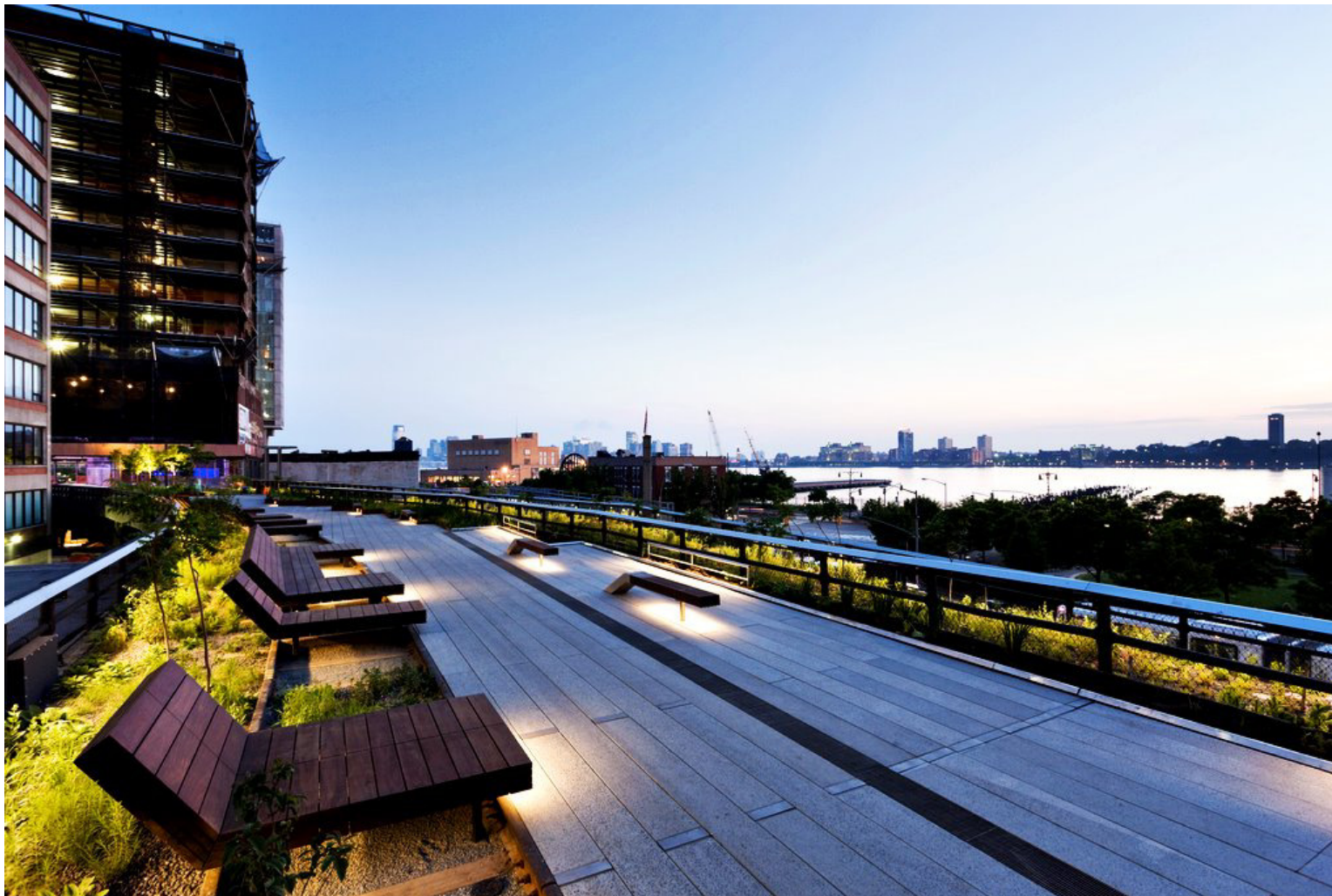
High Line an der West 20th Street, New York

http://www.orangesmile.com/extreme/img/main/high-line-park_1.jpg